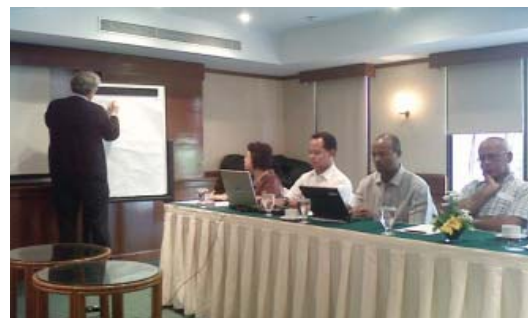
Tampak para pembicara dalam acara tersebut

Hasil yang diperoleh dari penyelenggaraan acara ini antara lain adalah bahwa kegiatan utama tahun 2010 adalah peningkatan kapasitas, implementasi batch 2 , dan replikasi oleh pemerintah daerah. Selain itu pengembangan pedoman yang menjadi salah satu tujuan program WES UNICEF diharapkan dapat segera diselesaikan pada kuartal 1 tahun