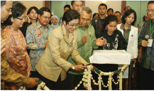
Menteri Kesehatan, Endang Rahayu Setyaningsih, meresmikan secara simbolis acara pameran KSN 2009