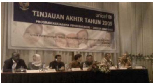
Salah satu sesi kegiatan lokalatih tersebut

Secara umum, hasil dari acara tinjauan akhir tahun ini adalah perlunya peningkatan koordinasi antar tingkat pemerintahan dalam pelaksanaan program, serta peningkatan kapasitas pemerintah daerah dalam pelaksanaan program, serta proses internalisasi program menjadi program pemerintah daerah. ■ FW