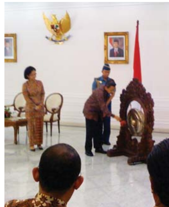
Wakil Presiden RI, Budiono, secara resmi membuka KSN 2009 di Istana Wakil Presiden Jakarta

"Pembangunan sanitasi bukan sekedar pembangunan fisik atau pemberian bantuan saja, tetapi juga keterlibatan masyarakat jauh