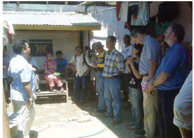
Wakil dari pemerintah Belanda, UNICEF, ESP, pemerintah daerah sedang berdiskusi dengan masyarakat di Kelurahan Wainitu yang merupakan daerah kumuh

Secara umum pelaksanaan kegiatan sudah menunjukkan hasil yang memadai walaupun karena keterbatasan dana, hasilnya jadi tidak terlihat signifikan. Salah satu hasil yang terlihat adalah mulai terjadinya perubahan perilaku masyarakat dari buang sampah ke sungai ke tempat