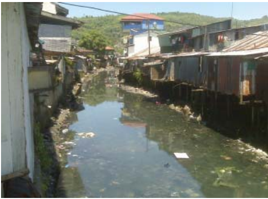
Kondisi sungai di kelurahan Wainitu dan Waihong, dimana limbah langsung dibuang ke sungai

di tingkat masyarakat. Diharapkan komite akan berfungsi membantu pemerintah sebagai saluran aspirasi dua arah; (iii) perubahan perilaku hidup bersih difokuskan pada anak-anak; (iv) kios sebagai sumber sampah utama akan memberi insentif pada anak-anak jika membuang sampah pada tempatnya. Sementara ibu-ibu akan diberi hadiah jika mengumpulkan sampah kemasan di kios; (v) selain itu juga dilakukan perlombaan kebersihan lingkungan dan lomba menghias