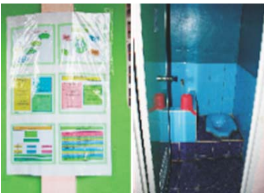
Salah satu sudut toilet sekolah program WES di Kabupaten Lombok Barat

Hal yang paling menarik dari pelaksanaan program WES di kabupaten ini adalah pada pelaksanaan komponen sekolah. Toilet sekolah yang sudah terbangun terlihat sangat terawat dan digunakan secara efektif bagi siswa. Satu hal yang juga mengesankan adalah sudah terintegrasinya promosi perilaku hidup bersih dan sehat di seluruh mata pelajaran yang ada dan dilanjutkan dengan tingginya komitmen orang tua murid untuk meneruskan perilaku hidup bersih dan sehat tersebut dalam kehidupan sehari-hari di rumah. ■ WIL