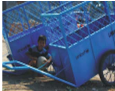
Sarana kegiatan pengelolaan sampah di Kota Mataram

Kegiatan misi supervisi yang dilaksanakan oleh Pokja Provinsi Nusa Tenggara Barat, Pokja Kota Mataram dan Pokja Kabupaten Lombok Barat