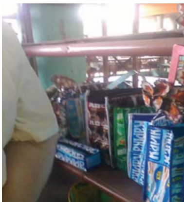
Hasil dari pengelolaan sampah

Kunjungan lapangan antara lain meninjau hasil pelaksanaan proyek Mercy Corps yang fokus pada pengelolaan sampah berbasis masyarakat atau yang dikenal dengan Proyek HP3 Lestari. Proyek ini sudah berusia hampir 3 tahun sejak dimulai pertama kali pada bulan Juni 2006. Hasil unik yang nyata di masyarakat adalah berupa ide menge-