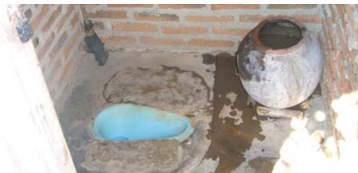
Salah satu contoh jamban keluarga paling sederhana di Desa Karampi

Sarana air minum yang dibangun adalah sistem perpipaan sederhana dengan total sambungan rumah sebanyak 518 unit dari total 535 rumah tangga yang ada di Desa Karampi tersebut. Sedangkan untuk sarana jamban keluarga sehat dari target pembangunan sarana sebanyak 535 rumah tangga, sampai pada saat kunjungan dilaksanakan telah terdapat 340 rumah tangga dengan sarana jamban keluarga sehat. Dengan kondisi demikian maka Desa Karampi telah mendeklarasikan desanya bebas buang air besar sembarangan. Masyarakat setempat memperkirakan setiap keluarga akan mempunyai jamban sehat pada akhir tahun 2009. Sarana jamban keluarga sehat yang dibangun masyarakat bervariasi dalam hal pembangunannya.