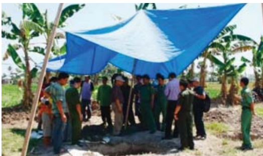
Anggota Tim Misi Evaluasi Program WES sedang melakukan kunjungan lapangan

Kegiatan Misi Evaluasi pada hari kedua dilanjutkan dengan rapat koordinasi dengan seluruh SKPD yang tergabung dalam Pokja AMPL Kab. Takalar yang bertujuan untuk melaksanakan evaluasi pencapaian pelaksanaan program secara keseluruhan. Pada tahun 2009 ini sendiri Pokja AMPL Kab. Takalar akan melakukan Program WES di 9 (sembilan) lokasi desa baru dan 2 (dua) diantaranya adalah desa replikasi yang menggunakan APBD. Melalui komitmen replikasi ini, seluruh pihak yang terkait dalam pelaksanaan Program WES di Kabupaten Takalar sangat optimis untuk mencapai hasil sesuai dengan yang ditargetkan dan tanpa masalah yang menghambat seperti apa yang telah dilakukan pada 2 (dua) desa sebelumnya. ■ WYU