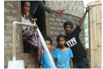
Warga Desa Mawar

Selain keterlibatan kepala desa yang menjadi motor keberhasilan pembangunan, ada pendekatan lain yang diharapkan dapat menjadi jawaban atas “ketidakberhasilan” banyak sistem perpipaan. Asumsi dasar yang digunakan adalah kebanyakan (bahkan hampir semua) sarana perpipaan perdesaan di Provinsi NTT menggunakan sistem kran umum. Hal inilah yang kemudian menimbulkan rasa ketidakadilan ditingkat masyarakat. Dengan kran umum, penggunaan air menjadi tidak dapat dikontrol dan dihitung secara tepat. Keluarga