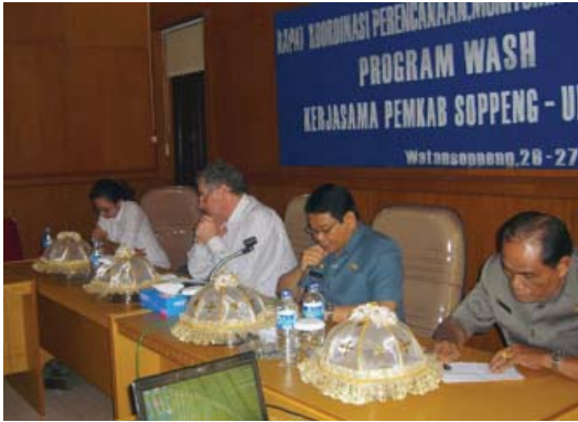
Tampak para pembicara dalam pertemuan tersebut