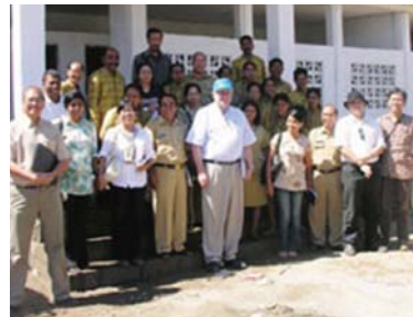
Para Anggota Tim Misi Evaluasi Program WES

Desa Bauho dan Desa Halimodok, Kab. Belu dan SD Tenubot adalah lokasi yang akan menjadi sasaran utama dalam kunjungan misi evaluasi kali ini. Berdasarkan hasil kunjungan lapangan ke sekolah dan desa, ditemui fakta bahwa pelaksanaan Program WES pada SD Tenubot, mengalami hambatan yang perlu segera ditangani. Pembangunan MCK sekolah yang sudah cukup baik namun tidak disertai perawatan yang