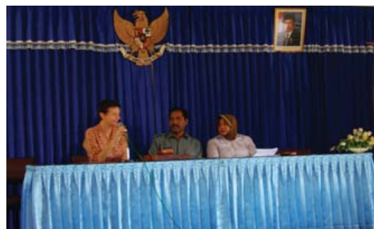
Para Pembicara Pertemuan Evaluasi dan Perencanaan Program WES Kota Kupang

menjadi kendala dalam melaksanakan program WES UNICEF di Kota Kupang. Acara yang berlangsung selama 2 hari ini diakhiri dengan ucapan terima kasih dan komitmen untuk melaksanakan output yang dihasilkan dalam kegiatan misi evaluasi ini yang disampaikan oleh Kabid. Sosial Budaya BAPPEDA Kota Kupang. ■ FWE/WIL