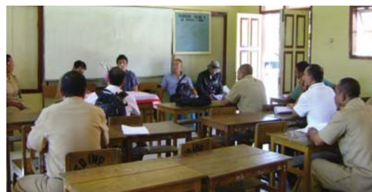
Tim Misi Supervisi sedang berada di salah satu sekolah

Diharapkan kegiatan misi supervisi yang rutin dilakukan setiap satu kali dalam setahun ini dapat memberikan output dalam rangka perbaikan kinerja WES UNICEF. ■ WIL